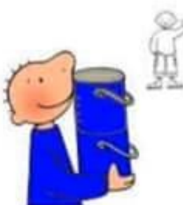
Zoek 5 blauwe voorwerpen