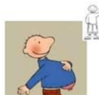
Spelen met ballonnen.