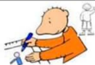
Maak een mooie tekening en stuur ze op naar iemand die je mist.