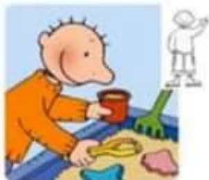
Spelen in de zandbak/plasticine.