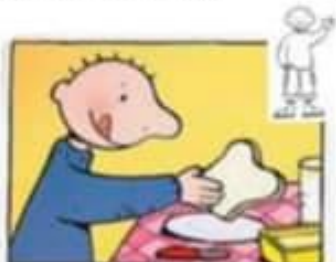
Smeer zelf je boterhammen.