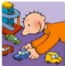
Spelen met de auto's.