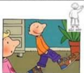
Wandelen in de schoenen van mama of papa.