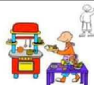
Mama of papa helpen koken.