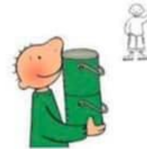
Zoek 5 groene voorwerpen