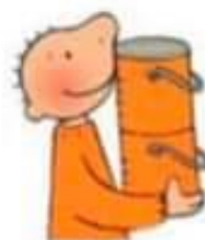
Zoek 5 oranje voorwerpen.