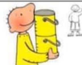
Zoek 5 gele voorwerpen.