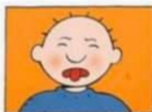
Stuur een zotte selfie in de groep.